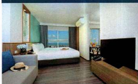
ห้องดีลักซ์ 28 ตร.ม.