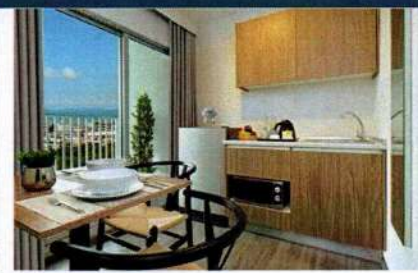
สิ่งอำนวยความสะดวกในห้อง