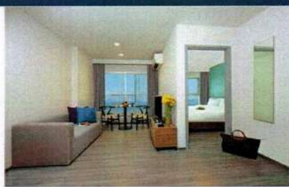
ห้องดีลักซ์พรีเมียร์ 33 ตร.ม.