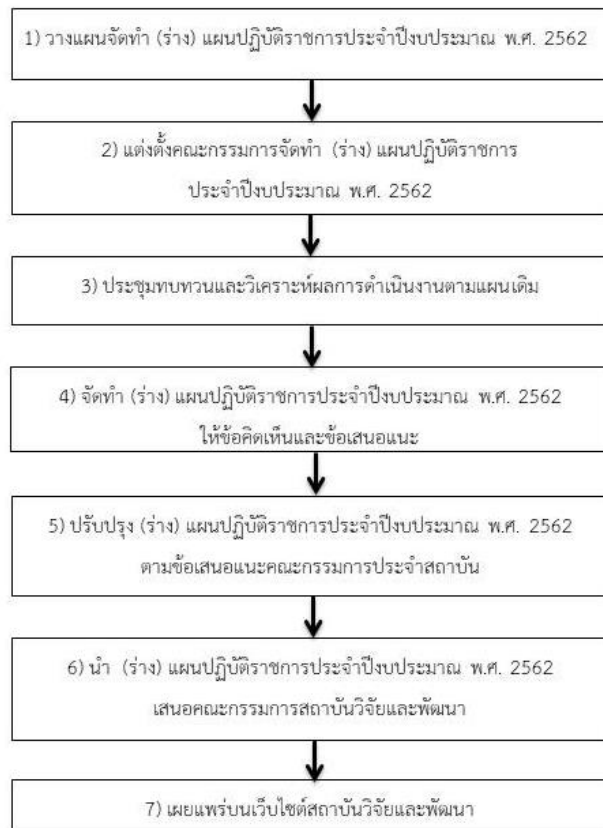
ภาพที่ 2.1 แสดงขั้นตอนการจัดทำแผนปฏิบัติการ ปีงบประมาณ พ.ศ. 2562