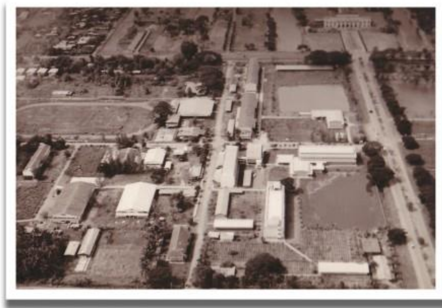
ภาพที่ ๒ มหาวิทยาลัยราชภัฏพระนครศรีอยุธยา ปีพุทธศักราช ๒๕๔๗

ต่อมาในปีพ.ศ. ๒๕๔๒ โดยได้ยุบรวมทบวงมหาวิทยาลัยและกระทรวงศึกษาธิการเข้าด้วยกัน และมีการปรับโครงสร้างการบริหารกิจการภาคอุดมศึกษาของประเทศใหม่ โดยกำหนดให้องค์กรทั้งหลายที่ดูแลกิจการภาคอุดมศึกษาในขณะนั้น ต้องผนวกรวมกันเป็นองค์กรเดียว ซึ่งก็รวมถึงสำนักงานสภาสถาบันราชภัฏด้วย แล้วให้ดำเนินงานภายใต้การกำกับดูแลของสำนักงานคณะกรรมการการอุดมศึกษา กระทรวงศึกษาธิการ พร้อมทั้งออกพระราชบัญญัติมหาวิทยาลัยราชภัฏ ยกฐานะสถาบันราชภัฏทั่วประเทศเป็น มหาวิทยาลัยโดยมีผลตั้งแต่วันที่ ๑๕ มิถุนายน พ.ศ. ๒๕๔๗ ทำให้สถาบันราชภัฏพระนครศรีอยุธยาได้รับการยกฐานะให้เป็น “มหาวิทยาลัยราชภัฏพระนครศรีอยุธยา” นับแต่นั้นเป็นต้นมา