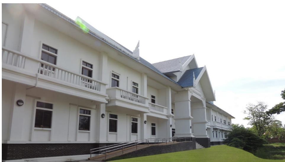
ภาพที่ ๓ คณะมนุษยศาสตร์และสังคมศาสตร์ มหาวิทยาลัยราชภัฏพระนครศรีอยุธยา ปีพุทธศักราช ๒๕๔๘