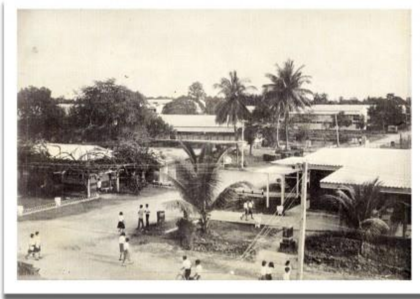
ภาพที่ ๑ โรงเรียนฝึกหัดครูพระนครศรีอยุธยา ปีพุทธศักราช ๒๔๔๘

มหาวิทยาลัยราชภัฏพระนครศรีอยุธยา กำเนิดจากโรงเรียนฝึกหัดครูเมืองกรุงเก่าซึ่งพระบาทสมเด็จพระจุลจอมเกล้าเจ้าอยู่หัว (รัชการที่ ๕) ทรงมีพระมหากรุณาโปรดเกล้าโปรดกระหม่อมพระราชทานพระราชทรัพย์จำนวน ๓๐,๐๐๐ บาท ให้กระทรวงธรรมการดำเนินการจัดตั้งโรงเรียนฝึกหัดครูขึ้น ณ บริเวณหลังพระราชวังจันทร์เกษม เมื่อวันที่ ๑ กรกฎาคม พ.ศ. ๒๔๔๘ จากนั้นได้พัฒนาเป็น โรงเรียนฝึกหัดครูพระนครศรีอยุธยา และวิทยาลัยครูพระนครศรีอยุธยาตามลำดับ เมื่อวันที่ ๑๔ กุมภาพันธ์ พ.ศ. ๒๕๓๕ พระบาทสมเด็จพระเจ้าอยู่หัวภูมิพลอดุลยเดช ทรงพระกรุณาโปรดเกล้าฯ พระราชทานชื่อวิทยาลัยครูทั้ง ๓๖ แห่งว่า “สถาบันราชภัฏ” นับเป็นพระมหากรุณาธิคุณสูงสุด แต่โดยนิตินัยยังไม่สามารถใช้ชื่อดังกล่าวได้ เพราะต้องมีการปรับพระราชบัญญัติวิทยาลัยครูให้เป็นพระราชบัญญัติสถาบัน ราชภัฏเสียก่อน